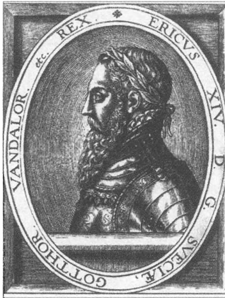
Эрик IV, король Швеции Гравюра XVI в.

Казани и Астрахани. Наконец, в 1569 году турецкая армия при поддержке войск крымского хана предприняла попытку отбить Астрахань. Для предотвращения угрозы была усилена оборона южных границ. На переволоку (место, где сближаются Дон и Волга) были отправлены войска под командованием боярина Петра Серебряного, в Нижний Новгород — князь Владимир Андреевич. Но турецкий поход оказался неудачным. Попытки устроить волок и перетащить суда и осадную артиллерию с Дона на Волгу не привели к успеху. Без огневой поддержки все попытки овладеть Астраханью, находящейся на острове и хорошо укрепленной, были заранее обречены на неудачу. Турки даже не стали штурмовать город, а 26 сентября отошли обратно к Азову. Неудача похода на Астрахань, впрочем, не означала успокоение на южных границах, наоборот, реальностью стали ежегодные широкомасштабные набеги крымских татар (вассалов Турции) на русские земли.