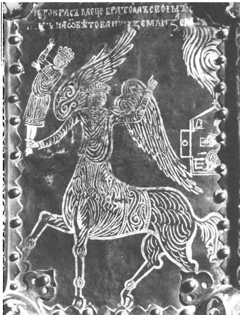
Клеймо с изображением кентавра-Китовраса на Васильевских воротах, выполненных в 1336 г. для Софийского собора в Новгороде. Повелением Ивана Грозного были увезены в Александровскую слободу

приглашение на пир. Посреди пира Грозный отдал приказ начать изъятие ценностей из местных церквей (казны, икон, колоколов), а архиепископу «желая воздать благодарность за его щедрость, он велит стащить с его головы тиару, которую тот носил, а вместе с тем снимает с него все епископское облачение... говоря: “Тебе не подобает быть епископом, а скорее скоморохом. Поэтому я хочу дать тебе в супружество