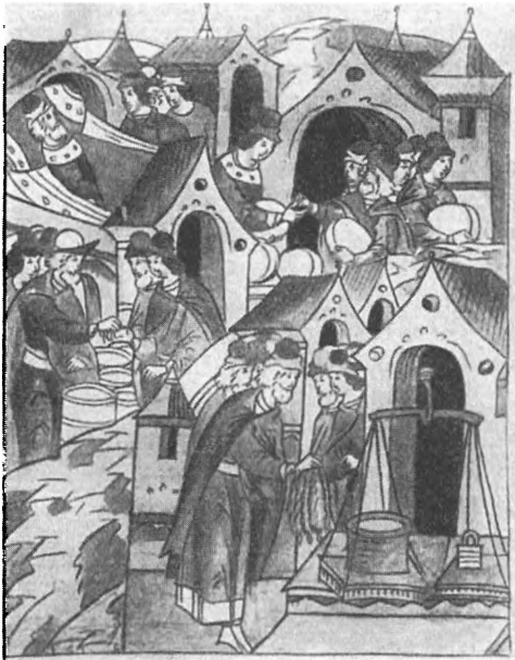
Торговля хлебом и медом в Новгороде Миниатюра Лицевого летописного свода. XVI в.

продолжавшегося конфликта это положение все более ухудшалось, а конца войны не было видно. В таких условиях единственным способом выживания для купцов было скорейшее заключение мира. Московское правительство, однако, не собиралось прекращать войну — Земский собор 1566 года высказался за ее продолжение. На Соборе присутствовали и представители купечества — в основном московского, новгородские же торговые люди не имели должного представительства.