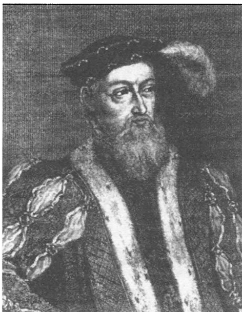
Христиан III, король Дании (1534–1559) Портрет XVI в.

Сам Иван IV в переписке с датским королем признает, что шведы и поляки грабят корабли, следующие в Нарву, и «в наше государство дорогу торговым людям затворили». Грозному пришлось даже выдать К. Роде грамоту с разрешением отлавливать иностранных пиратов. Но и эта мера не помогла — вскоре царь опять жалуется правителю Дании на действия шведов: их король «не хотя нам прибытка и нам грубачи... дорогу тое затворил и людей торговых всех государств грабит»*.