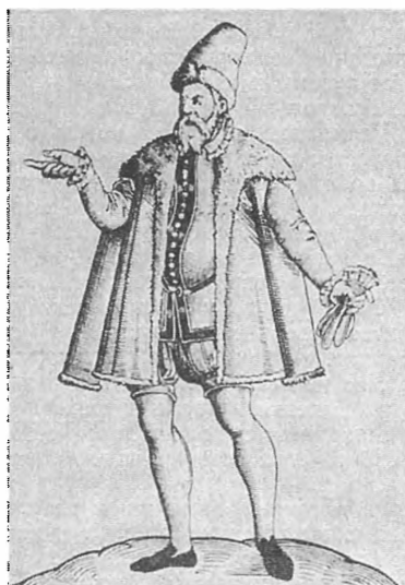
Иностраный купец Гравюра из книги С. Герберштейна. XVI в.

море не пустить». Воевода предлагает вести нормальную торговлю, так как по указу царя в Нарве жители Ревеля могут торговать свободно. В заключение послания содержится требование пропускать корабли за море «без задержки». Приведенное послание далеко не единственное. Сохранились подобные документы и от 1566, 1567, 1568, 1569 годов. Русские воеводы то просят, то угрожают ответными санкциями. Приведем некоторые отрывки из посланий воевод: «И вперед бы есте государя нашего ругодивских немец товаров грабити людем своим не велели и шкоты бы государя нашего людем не чинили никоторые ни в чем, тем бы есте от великого государя царя и великого князя Ивана Васильевича всея Руси на государя своего Ирика короля гневу не наводили». После оставшегося безответным послания последовало новое: «А вашего государя люди нашего государя людей ис кораблей товары на море грабят, шкоты им и обиды чинят великие. И толке мы учнем государя вашего людем в Ругодиге (Нарве. — В. Ш.) и на Иване городе шкоты и обиды чинити, и то будет добро ли, что в суседстве, браняся, жити?» Однако подобные просьбы и угрозы не имели ровным счетом никакого действия — захваты кораблей продолжались. Очевидно, что Ревель и Швеция не собирались мириться с усилиями русского правительства, направленными на расширение нарвского мореплавания.