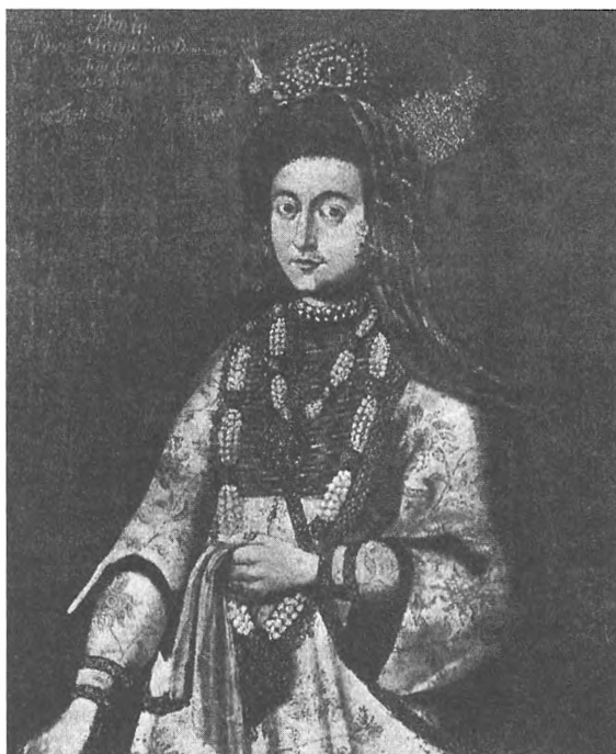
Мария Владимировна, королева Ливонии Портрет XVI в.

В чем же причины разгрома? В состав Русского государства Новгород окончательно вошел в 1478 году при Иване III. Вскоре из города были выселены местные бояре и крупные купцы. Их место заняли выходцы из Москвы и других центральных районов государства. Бывшие земли бояр передали помещикам. В Москве тщательно следили за ситуацией в недавно присоединенном крае. На пост наместников назначались лица, в преданности которых у правительства не было сомнений. Важнейший сан новгородского архиепископа доставался лишь специально подобранным представителям духовенства. В общем-то подобная политика дала свои плоды: во время выступления Андрея Старицкого в 1537 году новгородцы в своей массе не поддержали удельного князя.