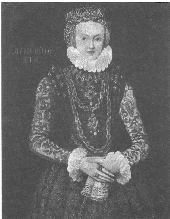
Екатерина Ягеллонка, жена Юхана Шведского Портрет XVI в.

происшедшего были безнадежно испорчены. Не за горами был новый вооруженный конфликт.