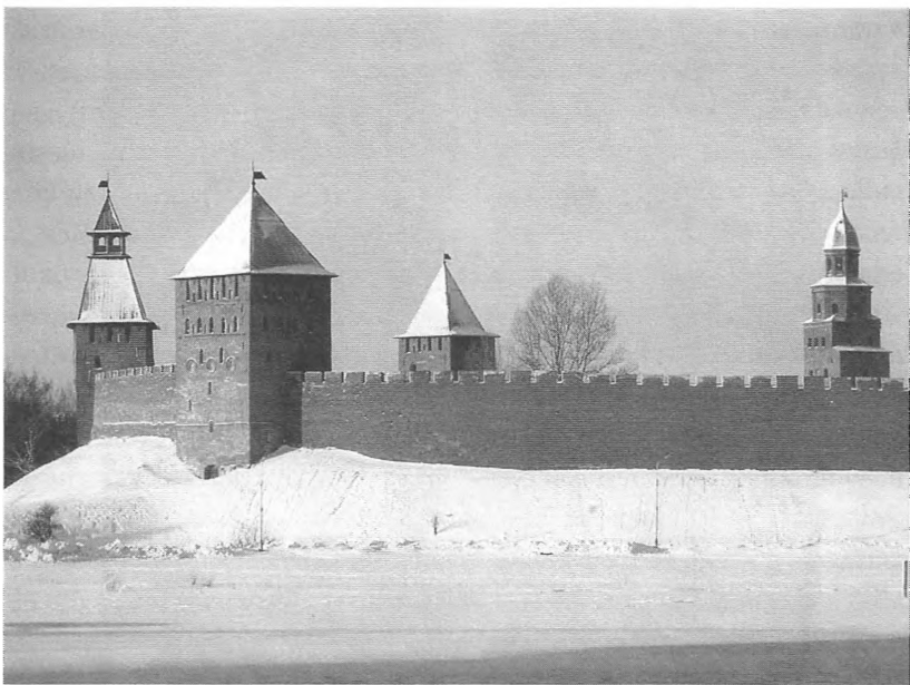
Стены и башни Новгородского кремля Построен в 1484–1490 гг.

Обращает на себя внимание то, что разгром оказался подлинной катастрофой для многих представителей местного купечества. Казнены были виднейшие купцы: Сырковы, Таракановы, Корюковы, Ямские. Разграблению и уничтожению подверглось имущество. Само по себе уничтожение двадцатилетних запасов экспортных товаров являлось наказанием торговым людям Новгорода за их недовольство политикой царя. Грозный был твердо убежден, что купечество города замешано в существующем (или воображаемом) заговоре. Торговых людей к участию в нем толкали реальные материальные интересы. Очевидно, что царь понимал, что товары не находят устойчивого сбыта, уничтожая их, он стремился уничтожить самый предмет недовольства. Иван IV полагал, что именно «лишние» богатства мешают некоторым его подданным выполнять свой долг — беспрекословно повиноваться данному Богом владыке. Забота о прибыли побуждает богатеев вмешиваться в политические дела, стремиться к участию в определении направления внешней политики государства.