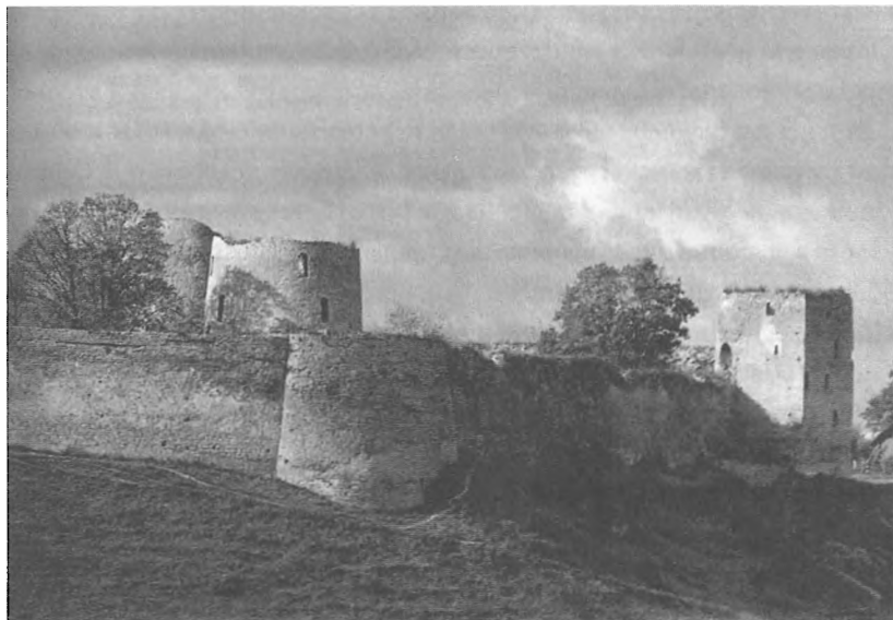
Изборск Фотография XX в.

России на западе благодаря значительному военному потенциалу нового государства. Резко обострились отношения со Швецией. Дело в том, что король Эрик XIV, с которым у России сложились вполне мирные отношения, был свергнут с престола в сентябре 1568 года. Незадолго до этого с ним было достигнуто соглашение о выдаче русскому правительству сестры польско-литовского короля Сигизмунда II Августа Екатерины. Особую пикантность ситуации придавало то, что к этой Екатерине сватался сам Иван IV после смерти Анастасии, но в результате она вышла замуж за шведского принца Юхана, брата короля Эрика. Вскоре после этого Юхан попал в заключение, а с Эриком подписали договор о выдаче Екатерины. Царь впоследствии заявлял, что считал ее мужа Юхана мертвым, а Екатерина ему нужна была для давления на Сигизмунда II Августа. В обмен Грозный согласился вести непосредственные переговоры со шведским правительством, минуя новгородских наместников. В Стокгольм даже прибыло русское посольство, которому и должна была быть передана принцесса. Но к тому времени обстановка в Швеции уже была крайне напряженной. Стало известно о безумии короля Эрика и о поднятом его братьями мятеже. В конце концов Эрик был арестован, а королем стал его брат, муж Екатерины Юхан, отношения с которым после всего