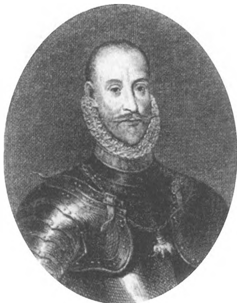
Фредерик II, король Дании (1559–1588) Портрет XVI в.

внешнеторговая сделка была сопряжена с большим риском — купец мог потерять все в результате нападения корсаров. Прибыли от торговли сократились. Можно было попытаться найти другие, более надежные каналы для сбыта своих товаров на Запад. Но северный торговый путь был не очень доступен новгородцам — сливки снимали купцы Холмогор, Вологды и Москвы. Кроме того, доставка товаров на Северную Двину требовала больших затрат, причем было неизвестно, окупятся они или нет. Англичане также были заинтересованы в том, чтобы найти путь в Новгород. В конце концов им это удалось. Но едва ли этот маршрут мог привлечь — путь занимал более месяца. Кроме того, товары по этому пути можно было перевозить только зимой. Как отмечали сами англичане, «нет никакой надежды на то, что туземцы повезут свои товары из Новгорода... чтобы продать нам». Очевидно, что, пока существовала хоть малейшая надежда на то, что товары можно сбывать иностранцам у себя под боком — в Нарве, новгородские купцы вряд ли серьезно переориентировали свои операции на север.